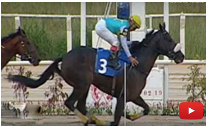
Motivo de Alegria