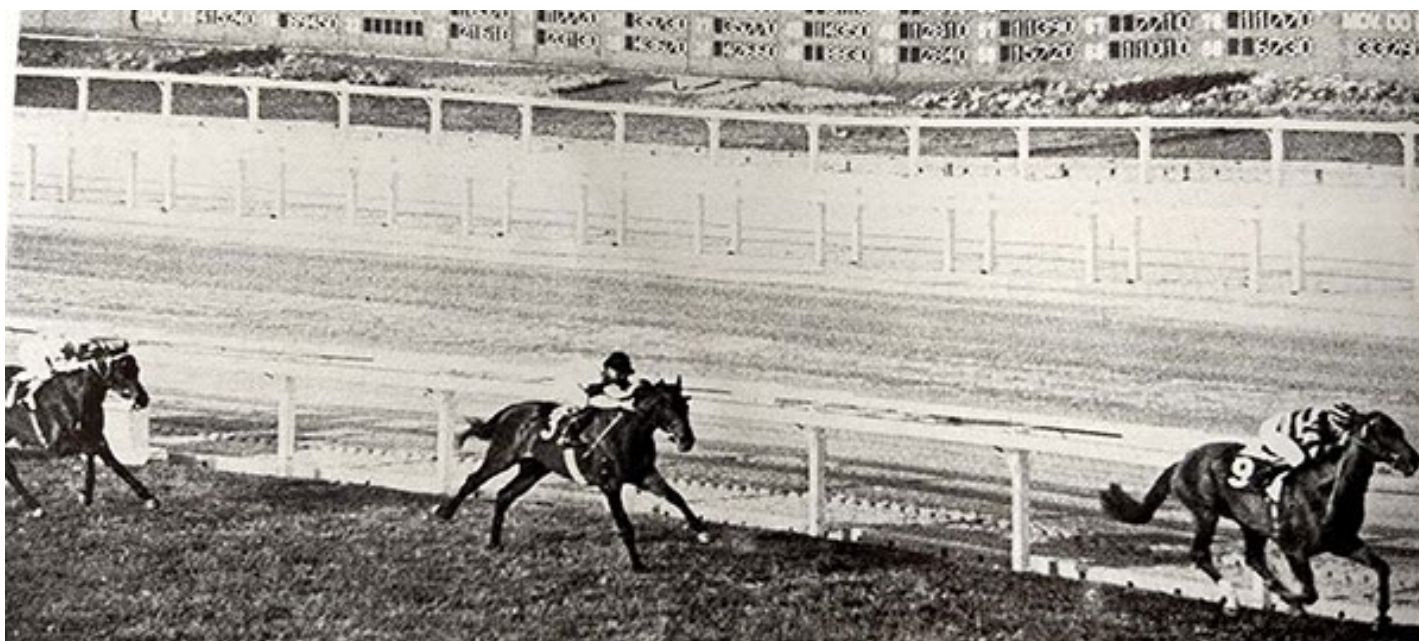
Eylau vence o GP Derby Paulista de 1971, seguido por Tonnerre e Mani