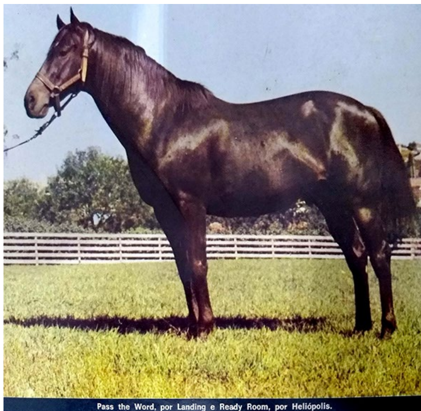
Pass the Word, por Landing e Ready Room, por Heliópolis.

Hymne , sua mãe, ganhadora de 4 provas e 3ª colocada no GP Diana, produziu além de Tonnerre os ganhadores Telina (5 vits., inclusive GP Barão de Piracicaba, Clássico Pres. Luiz Alves de Almeida, Clássico Pres. Antonio T. de Assumpção Netto), Nuvola (2 vits.), Orateur (2 vits.), Reveillon (2 vits.), Ultriz (1 vit.), e Veleiro (2 vits.).