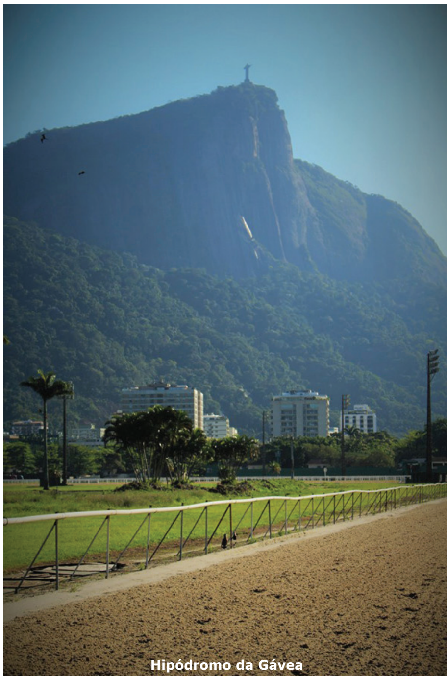
Hipódromo da Gávea