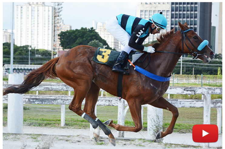
Love "N" Happiness