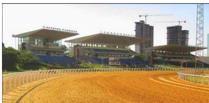
Hipódromo do Cristal