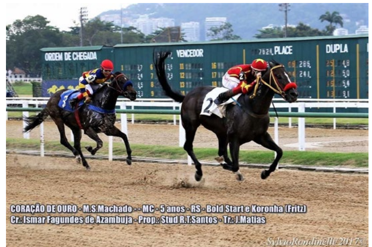
CORAÇÃO DE OURO - M.S.Machado -- MC - 5 anos - RS - Bold Start e Koronha (Fritz) Cr: Ismar Fagundes de Azambuja - Prop: Stud R.T.Santos - Tr: J.Matias

22/12 – Coração de Ouro , m, 5, por Bold Start (USA) e Koronha, por Fritz (USA) 35 apresentações – 9 vitórias – 1100m AM – 1'07"800 P: R.T. Santos C: Ismar Fagundes de Azambuja T: J. Matias J: M.S. Machado