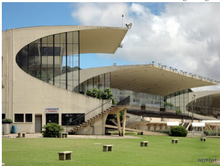
Hipodromo do Tarumã