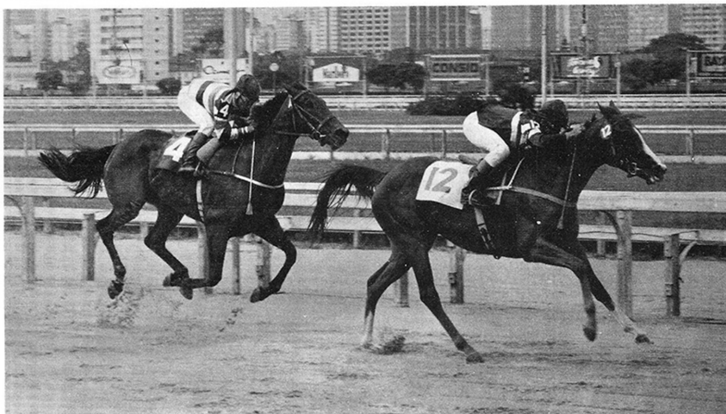
Flying Panther derrota Princesse de Lune em 2.000 metros, areia encharcada.