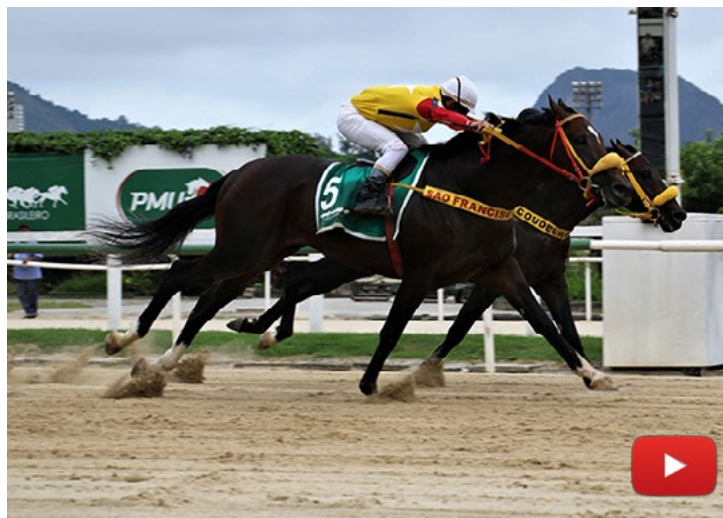
Leão de Prata