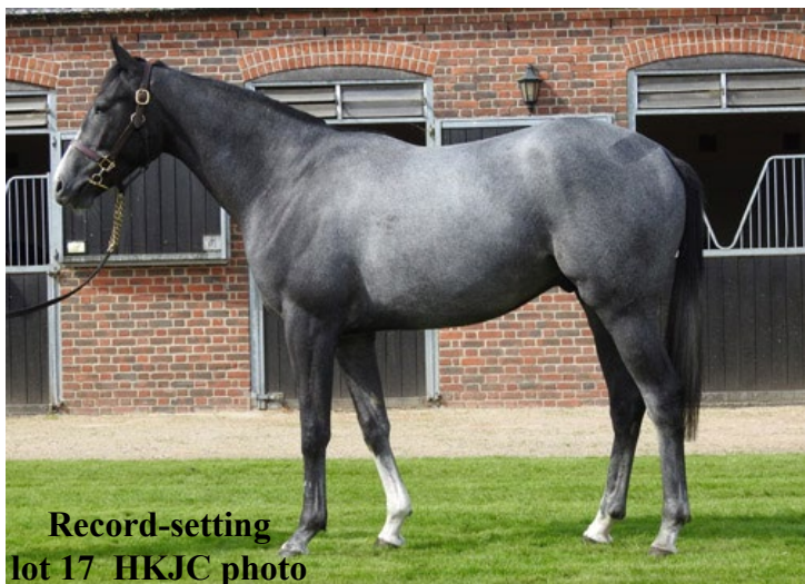
Record-setting lot 17

A Holy Roman Emperor (Ire) gelded half-brother to 2017 G1 Investec Derby hero Wings of Eagles (Fr) (Pour Moi {GB}) fetched a final bid of HK$11 million (£1,006,423/€1,141,773/AS$1,810,647/US$1,402,492) to establish a new record price at Friday's Hong Kong International Sale conducted in the parade ring at Sha Tin Racecourse. The previous mark of HK$10.5 million was set just last year by a son of Hussonet.