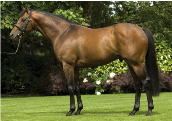
Rock of Gibraltar