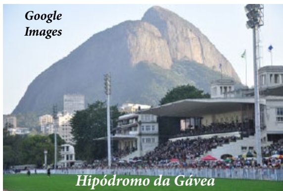
Hipódromo da Gávea