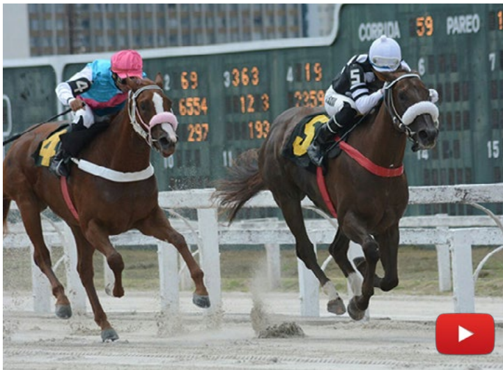
Novinha A Mil

CIDADE JARDIM (SP) - 17/Fev. GRANDE PRÊMIO PRES. EDUARDO DA ROCHA AZEVEDO, G3 1200m - Areia - Produtos de 2 anos - 1'11"122 1- R$ 18.000,00 2- R$ 5.400,00 3- R$ 3.600,00