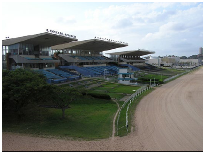
Hipódromo do Cristal