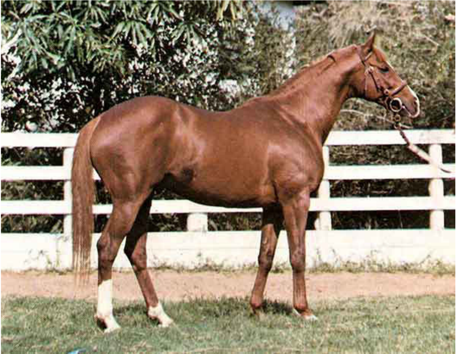
Viziane, pai de Hiper Gênio