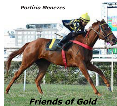
Friends of Gold