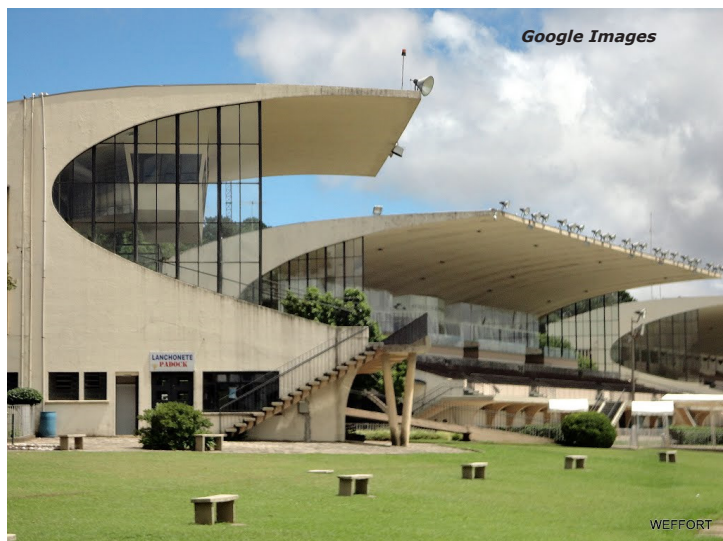
Hipódromo do Tarumã

TARUMÃ (PR) - 15/Junho CLÁSSICO DERBY PARANAENSE, L 2000m - Areia - Produtos de 3 anos - 2'10"500 1- R$ 7.000,00 2- R$ 2.100,00 3- R$ 1.400,00