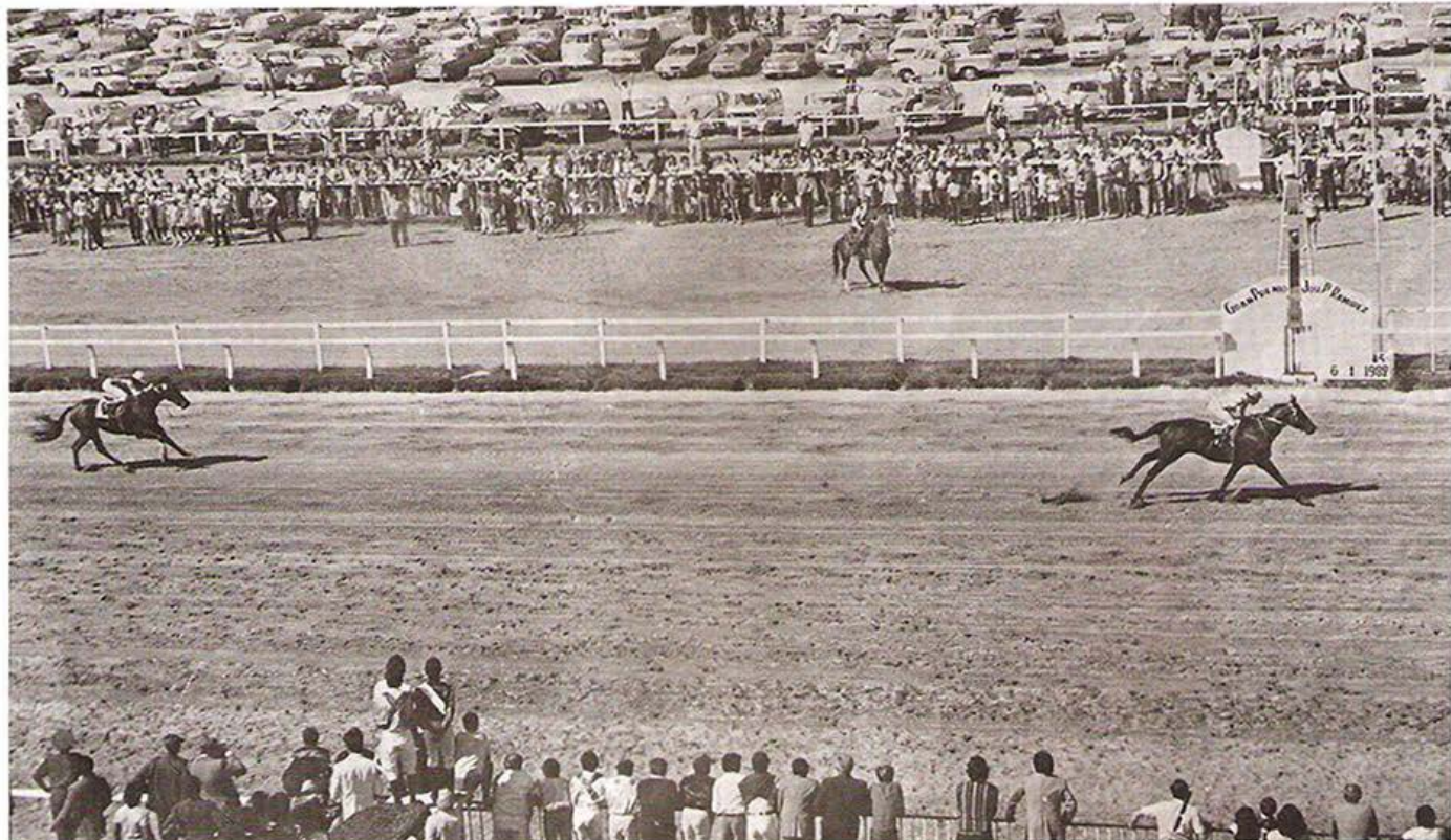
Duplex, ao final dos 2.400 metros, trazia mais de sete corpos de vantagem sobre o segundo colocado, Galisteo.