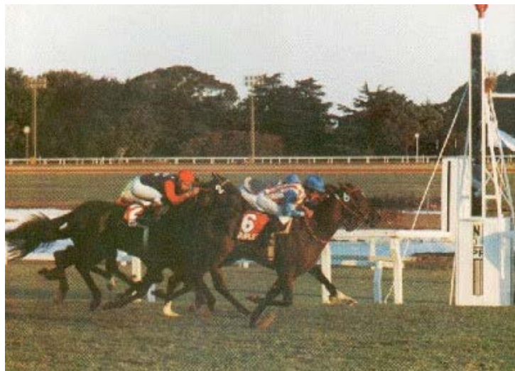
GP. II ALAJC