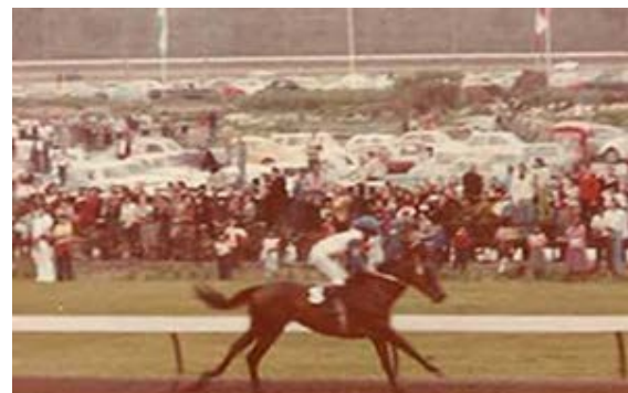
GP. JOCKEY CLUB DEL PERU

1º II Gran Prêmio Internacional Asociacion Latino Americana de Jockey Clubs, G1 - 2000m [ San Isidro ]