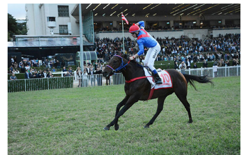
Céu de Brigadeiro