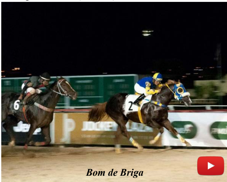
Bom de Briga