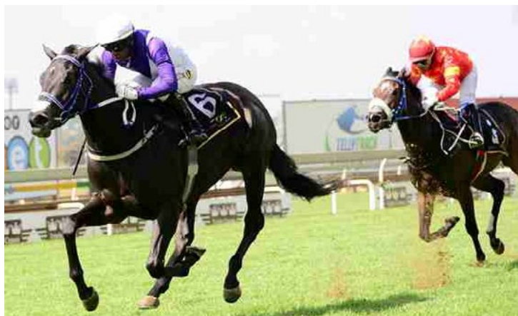
Celtic Sea, filha da brasileira Ireland