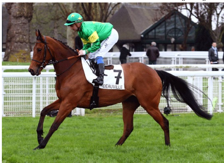
Coeur de Beaute

Avô materno de: Aronius -Ger (m, 3 Pai: Pastorius-Ger e Aronia-Ire)