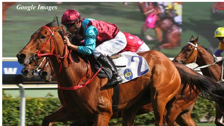
Beat The Clock